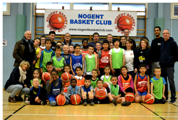
Les 8 / 12 ans